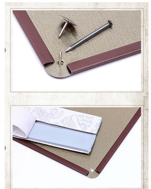
Bef.: Nägel, Montageband

Bei einer Bestellung ist der Typ (BT1 ...BT4) anzugeben.